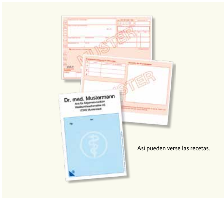
Así pueden verse las recetas.