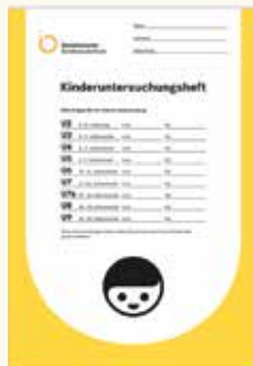
Así se ve el cuaderno de exámenes (U-Heft)

Estos exámenes son muy importantes. Acuda por lo tanto a todos ellos y lleve siempre consigo el cuaderno de exámenes (U-Heft) así como la cartilla de vacunas de su hijo/a. Estos exámenes son por la salud de su hijo/a