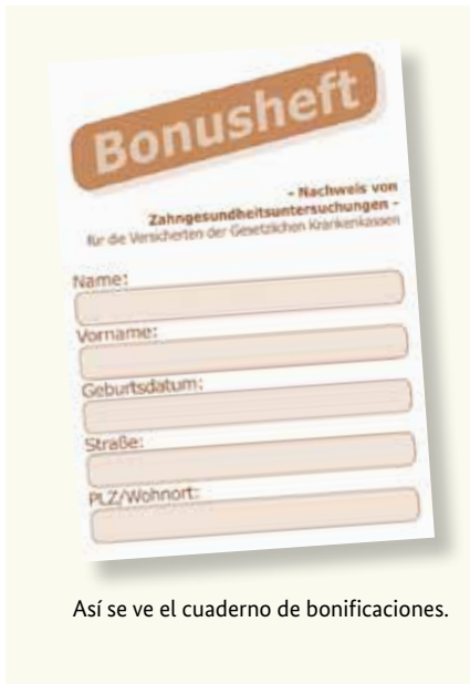
Así se ve el cuaderno de bonificaciones.

Unos dientes sanos suponen una buena calidad de vida. De ahí la importancia de las revisiones preventivas – aún cuando no tenga molestias. El seguro médico obligatorio cubre también estos exámenes preventivos. Estas revisiones tienen el fin de reconocer y tratar enfermedades dentales a tiempo. Para ello puede obtener un “cuaderno de bonificaciones” (Bonusheft) de su compañía de seguro médico, en el que se anotarán los exámenes preventivos. Si usted puede demostrar que ha acudido por lo menos una vez al año al dentista (para menores de edad como mínimo dos veces al año), su seguro médico le abonará una mayor cuantía cuando necesite prótesis dentales.