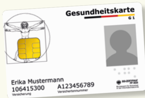
Ejemplo de muestra de una tarjeta sanitaria

Por favor, lleve siempre su tarjeta sanitaria electrónica (elektronische Gesundheitskarte) consigo cuando quiera recibir atención médica. Desde el 1 de enero de 2015 esta tarjeta constituye el único documento que acredita su derecho a recibir las prestaciones del seguro médico obligatorio. En la tarjeta sanitaria están registrados el nombre, la fecha de nacimiento, la dirección, el número de asegurado y el estado del asegurado (miembro, familiar o pensionado). Estos datos son obligatorios. La tarjeta sanitaria contiene además una fotografía en color.