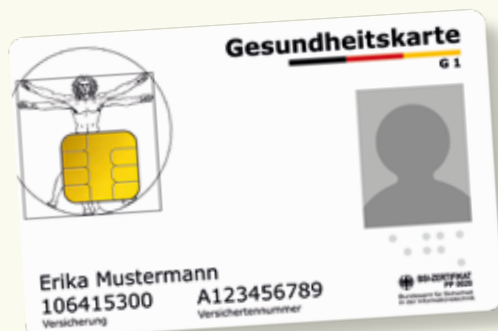
Exemplu model al unui card de sănătate

Va rugăm să aveți cardul electronic de sănătate permanent la dumneavoastră, când utilizați serviciile de sănătate. Începând cu 1 ianuarie 2015 acest card este exclusiv valabil ca dovadă de autorizare pentru a putea beneficia de serviciile asigurării de sănătate obligatorie. Pe cardul electronic de sănătate sunt salvate ca date obligatorii numele, data nașterii și adresa dumneavoastră cât și numărul dumneavoastră de asigurat medical și situația dumneavoastră de asigurat (membru, asigurat al familiei sau pensionar). Cardul electronic de sănătate conține și o fotografie cu dumneavoastră.