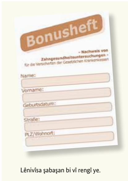
Lênivîsa şabaşan bi vî rengî ye.

Diranên saxlem parçeyek in ji qalîteya jiyane ne. Ji ber wê jî bi şeweyekî berdewam pişkinîna wan giring e, eger we çu gazinde û êş jî ji diranên xwe nebin. Qasa sîgorta tendurustiyê ya yasayî hemî mesref û xerciyên xizmetguzariya pişkinîne jî bi xwe digire. Ev pişkinîn jî dibin alîkar, bo hin nexweşiyên destnişankirî, ku berwext bêne diyarkirin û naskirin û her weha dermankirin. Hun dikarin ji sîgorta xwe ya nexweşiyê wek tê gotin “lênivîsa şabaşan” (Bonusheft) werbigirin. Di wê lénivîsê de pişkinînen we yên hun bikin tene nivîsin. Eger hun bikaribin, ku we bi kêmanî salê carekê (di bin 18 salî re bi kêmanî her niv salê carekê) diyar bikin, ku we seredana bijîjkeka diranan an bijîjkekî deranan kiriye, wê qasa sîgorta we ya nexweşiyê perene zêde di ser re bide, eger şûndiraneke pêdivî be.