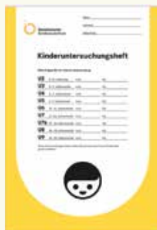
Lênivîsa pişkinînan (U-Heft) bi vî rengî ye.

Ev pişkinînên han zor giring in. Ji kerema xwe re, ji ber wê hindê pêdivî ye, ku hun pişkinînan bi cedî bistînin û herdem di gel xwe wê lênivîsa pişkinînan (U-Heft) û lênivîsa vaksînlêdanê ya zaroka xwe bînin. Ew pişkinîn ji bo tendurustiya zaroka we ye.