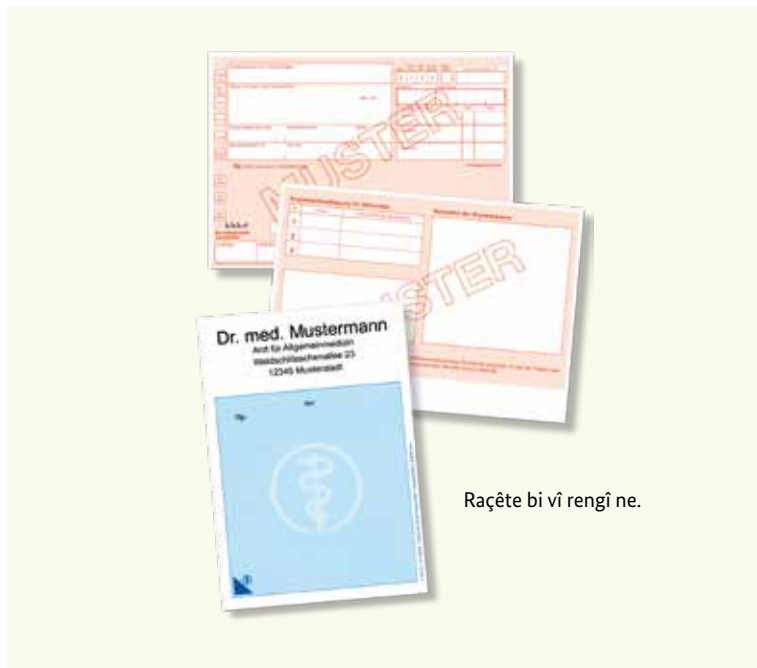
Raçête bi vî rengî ne.