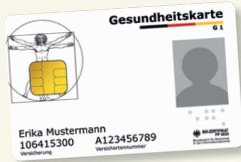
مثال لنموذج البطاقة الصحية

الرجاء أن تأخذوا معكم دائماً البطاقة الصحية الإلكترونية (Elektronische Gesundheitskarte)، عندما تريدون أن تستفيدوا من الخدمات الصحية. ولا يصلح منذ الأول من كانون الثاني 2015 إلا استخدام هذه البطاقة حصراً كإثبات إستحقاق، من أجل أن يمكنكم الإستفادة من حق الحصول على مزاييا شركات التأمين الصحي القانوني. ويتم في البطاقة الصحية الإلكترونية تخزين إسمكم وتاريخ ميلادكم وعنوانكم ورقم تأمينكم الصحي أيضاً ووضع تأمينكم (عضو، ومؤمن عليه عائلياً، أو متقاعد) كمعلومات ملزمة. وعدا عن ذلك تحتوي البطاقة الصحية الإلكترونية على صورة ضوئية لكم.