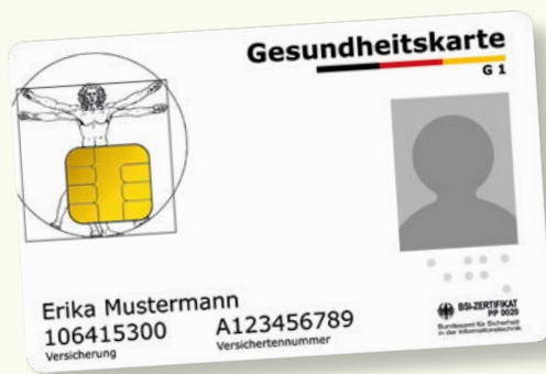
Образец полиса медицинского страхования в виде электронной карточки.

При обращении за медицинской помощью необходимо всегда иметь при себе полис медицинского страхования (elektronische Gesundheitskarte) в виде электронной карточки. Начиная с 1 января 2015, обслуживание застрахованных в системе государственного страхования возможно только по этой карточке, подтверждающей право ее владельца на получение услуг. На электронной карточке в обязательном порядке содержатся ваши данные: имя, фамилия, дата рождения, место проживания, номер страхового полиса, статус (застрахованный, совместно застрахованный, пенсионер), а также имеется ваша фотография.