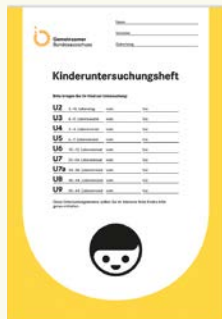
Так выглядит «Книжка профилактических осмотров ребенка».

Данные осмотры очень важны для здоровья ребенка. Обязательно пройдите все предложенные осмотры, с собой надо всегда иметь «Книжку профилактических осмотров ребенка» („U-Heft“) и паспорт прививок.