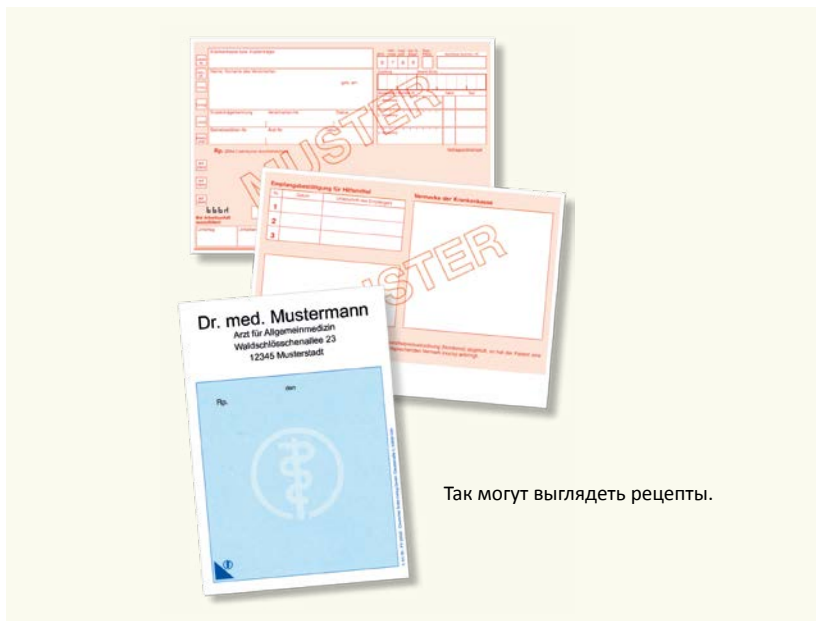
Так могут выглядеть рецепты.