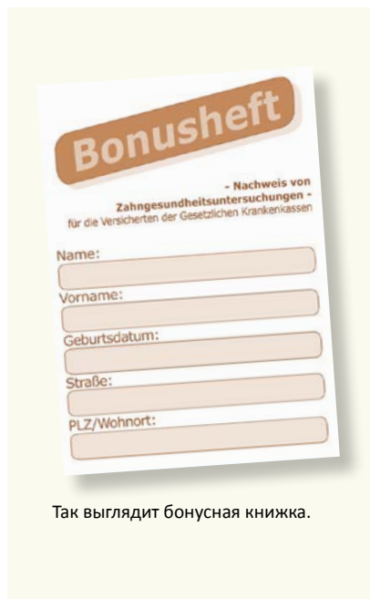
Так выглядит бонусная книжка.

Здоровые зубы – это еще и показатель уровня качества жизни. Поэтому так важны регулярные профилактические осмотры, даже и при отсутствии жалоб с вашей стороны. Больничными кассами в системе обязательного медицинского страхования перенимаются расходы на профилактику. Данные мероприятия помогают своевременно выявить и начать лечить определенные заболевания. Вам выдадут бонусную книжку (Bonusheft), куда заносится дата прохождения профилактических осмотров. Если вы можете подтвердить, что ежегодно (в возрасте до 18 лет – каждые полгода) посещали стоматолога, то при необходимости протезирования больничная касса предоставляет более высокие дотации.