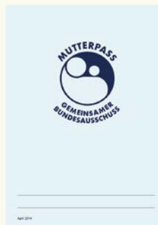
Так выглядит паспорт матери.

В материнский паспорт заносятся данные профилактических осмотров, сведения о том, как протекает беременность и о том, как развивается плод в утробе матери. Беременной женщине следует поэтому постоянно иметь данный документ при себе.