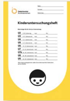
Pirtûka Muayeneyê (U-Heft) bi vî awayî ye.

Ev muayeneyên han gelek girîng in. Ji ber wê yeke, bi kerema xwe, hemû mueyeneyan bi cidî bistînin û herdem, wê pirtûka muayeneyê (U-Heft) û her weha pirtûka perpûnlêdanê (Impfpass) ya zaroka xwe di gel xwe bînin. Ew muayene, ji bo tenduristîya zaroka we ye.