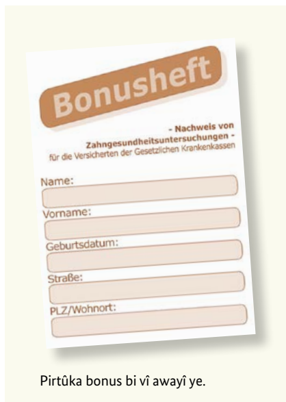
Pirtûka bonus bi vî awayî ye.

Hûn dikarin ji kasaya xwe ya nexweşiyê, wekî tê gotin “pirtûka bonûsê” (Bonusheft) werbigrin. Di vê pirtûkê da tedbirên zûtirin têne nivîsandin. Ger hûn bikaribin îsbat bikî, ku bi kêmanî salê carekê çûne li def doktorê diranan (herî kêm şeş mehan carekê, di bin temenê 18 salî da), wê kasaya nexweşiyê bexşeyek zêdetir bide, ger cîbicîkirina diranên taybet pêwîst be.