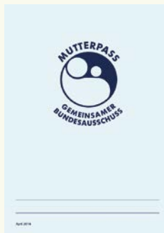
Pasporta dayîkê, bi vî awayî ye.

Di pasporta dayîkê da, dê hemû agahdarîyên muayeneyên tedbîrgirtinê, birêveçûna ducanîyê û di dema ducanîyê da pêşdeçûnên zarok, tête tomarkirin. Kesên ducanî, divê her dem pasporta dayîkê (Mutterpass) li gel xwe bibin.