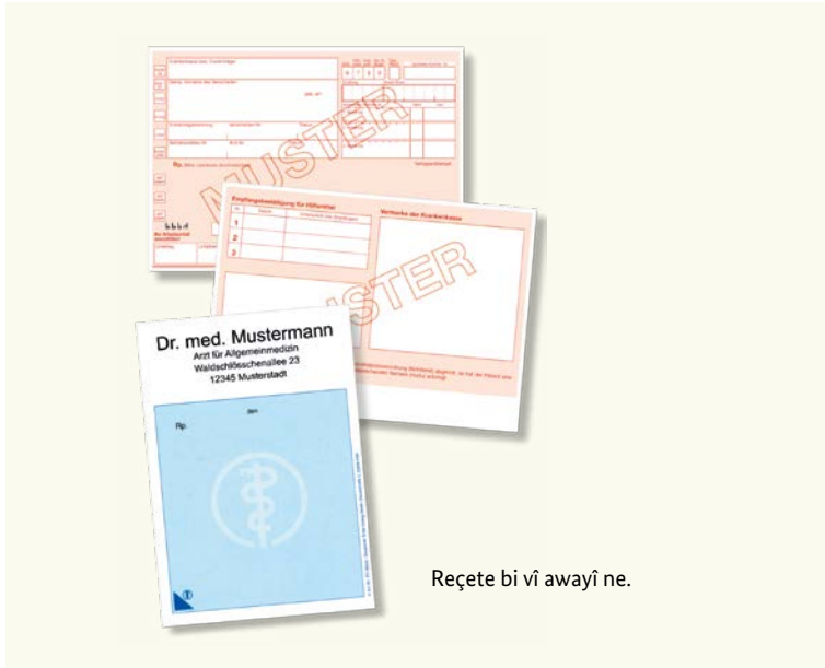
Reçete bi vî awayî ne.